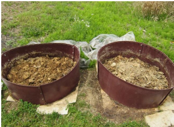
ひまわり油搾り粕で作った堆肥

その堆肥で野菜を作りました「ハウス写真」(ミニトマト・なす・水なす・シシトウ・パプリカ・中玉トマトなどです) 旨くできるでしょうか?出来た暁には希望者に オ・ス・ソ・ワ・ケ